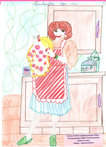
Рисунок Ростовщиковой Софьи, 6 класс