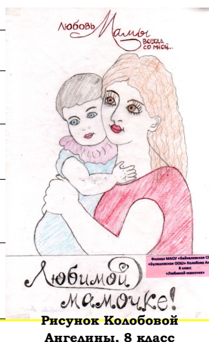
Рисунок Колобовой Ангелины, 8 класс